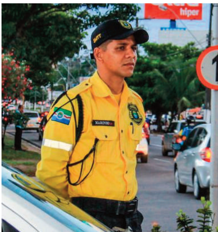
Fotos de um agente de trânsito e uma guarnição da Polícia Militar. Meramente ilustrativas

“Se ele fez isso com um coronel, imagine com um soldado, com um cabo, com um sargento”, questionou, referindo-se ao agente de trânsito que fez a abordagem ao infrator.