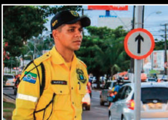
Foto de um agente meramente ilustrativas