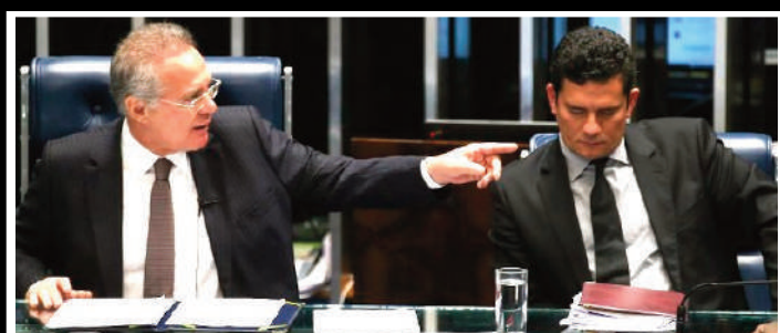
Senador disse ainda que ministro tentará ser deputado estadual