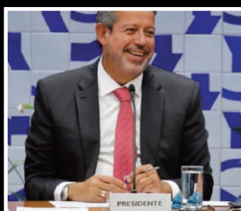
Deputado ficou furioso ao ser obrigado a usar tornozeleira eletrônica

Dossiê descobre quem é o "Queiroz" de Arthur Lira