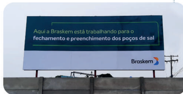
Canteiro central da obra de fechamento de poços de sal

Com o encerramento definitivo da extração de sal, os 35 poços vêm sendo fechados ou preenchidos e seguem sob monitoramento , com todo o trabalho acompanhado pela Agência Nacional de Mineração (ANM). É por conta dessas obras, sinalizadas com placas informativas, que existe a movimentação de caminhões e máquinas nos bairros do Pinheiro e Bebedouro, com medidas especiais para evitar problemas no tráfego e na segurança das pessoas.