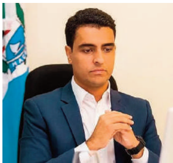
O nome mais forte do partido é JHC

A decisão do PSB foi comunicada publicamente após reunião entre os presidentes dos quatro partidos. Parlamentares das siglas também estiveram no encontro. "A definição, no momento, é para os três partidos, PT, PV e PCdoB. O PSB, neste momento, não tem a decisão de participar, não. Mantém o diálogo com os três partidos", disse Siqueira. "Nós nunca colocamos a questão da vinda do ex-governador Geraldo Alckmin ao PSB à questão da federação."