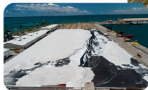
Estoque de sal no porto de Maceió