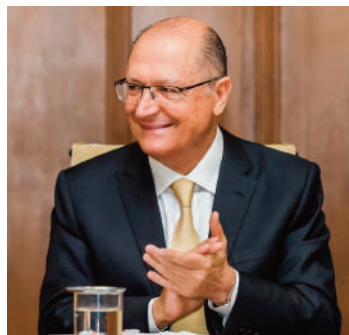
Geraldo Alckmin como vice de Lula