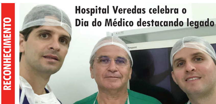
Hospital Veredas celebra o Dia do Médico destacando legado

Ano XIX - Edição 752 - R$ 2,00 - Maceió, 19/10 a 25/10 de 2019